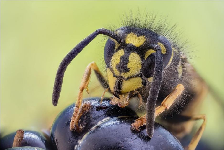
Gemeine Wespe